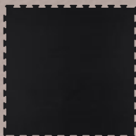
PAVIGYM JET BLACK