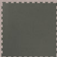
PAVIGYM STONE GREY