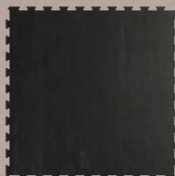
PAVIGYM B. MARBLE